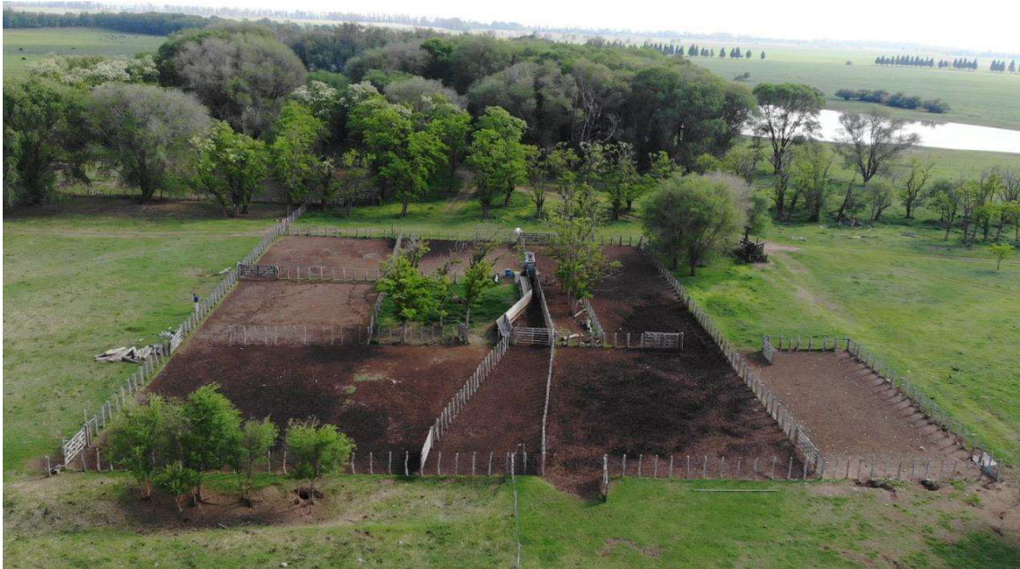
Imagen 7. Manga con corrales de aparte.