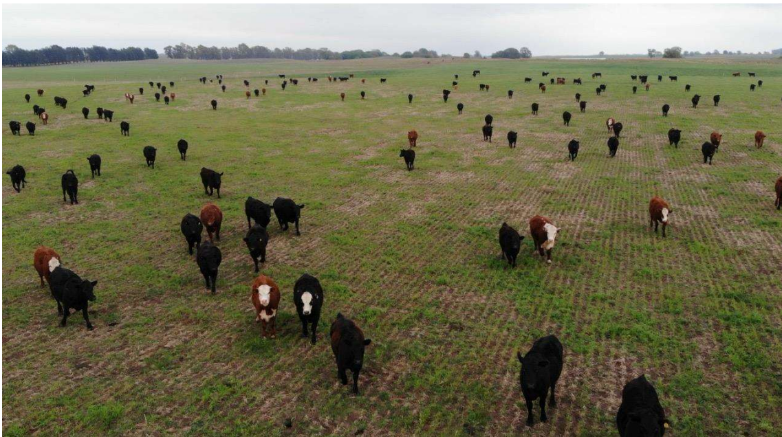
Imagen 2. Combinación de ganadería y agricultura son un planteo ideal para estos campos.

📞 2954 269107 | ✉ nicolasalexishus@gmail.com | 🌐 www.nicolashus.com.ar