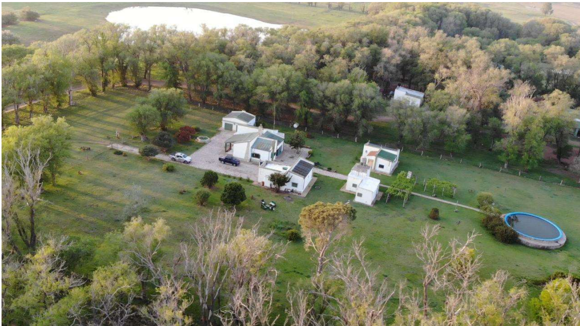
Imagen 3. Casco del establecimiento con todas sus comodidades.