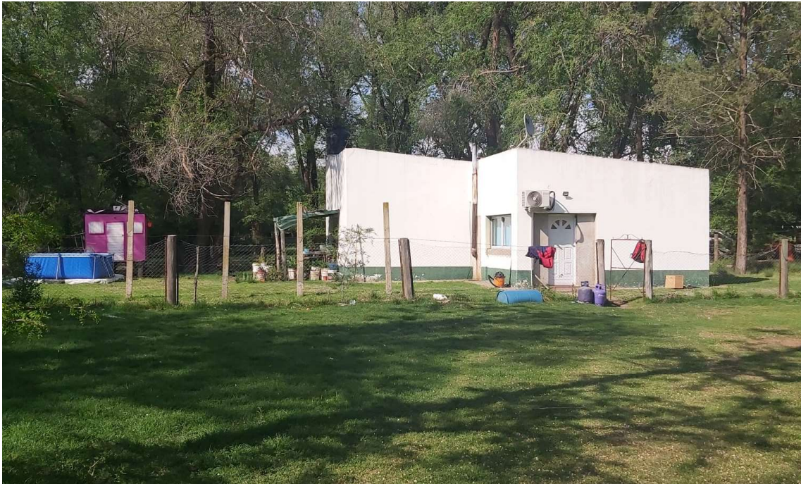
Imagen 4. Casa para encargado.

📞 2954 269107 | ✉ nicolasalexishus@gmail.com | 🌐 www.nicolashus.com.ar