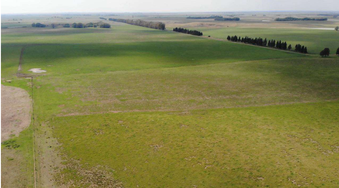
Imagen 1. Relieve característico de la zona con bajos planos altamente productivos y lomas medanosas.