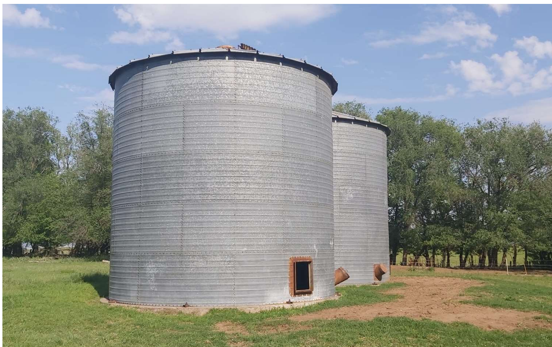
Imagen 6. Silos fijos.

📞 2954 269107 | ✉ nicolasalexishus@gmail.com | 🌐 www.nicolashus.com.ar