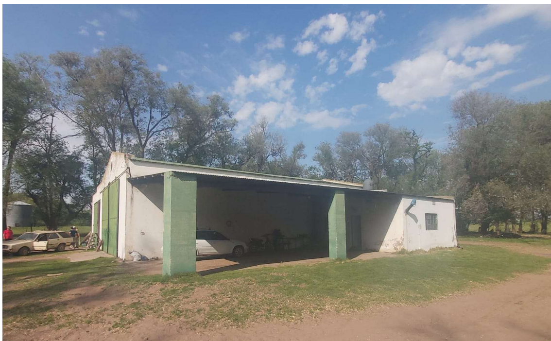
Imagen 5. Galpón con casa anexa.