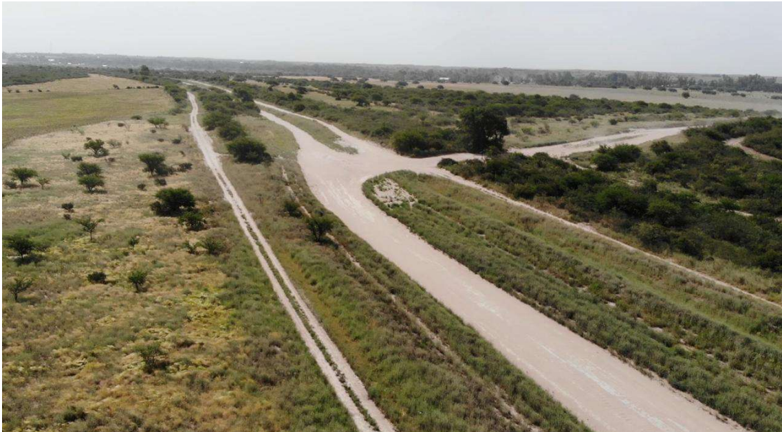
Imagen 1. Frente del campo sobre la Ruta Provincial 9.