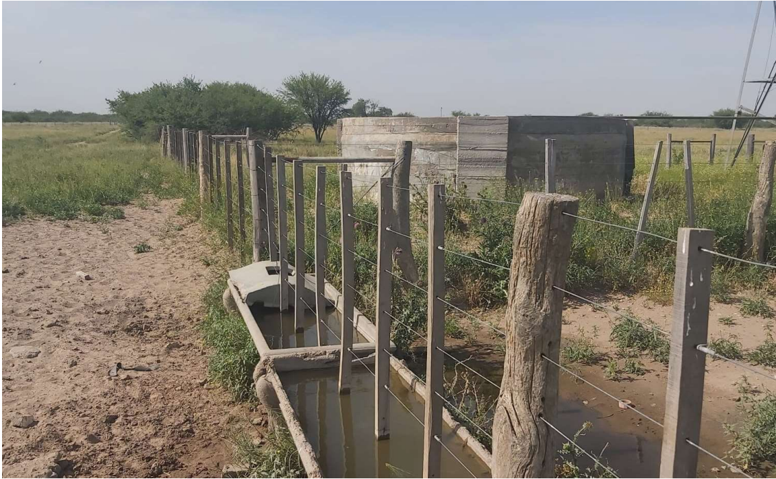
Imagen 6. Bebida con tanque de servicio.