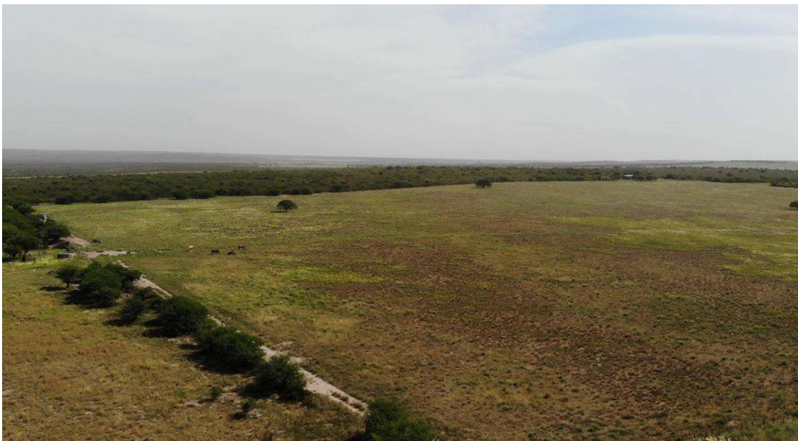
Imagen 3. Imagen aérea del lote limpio.