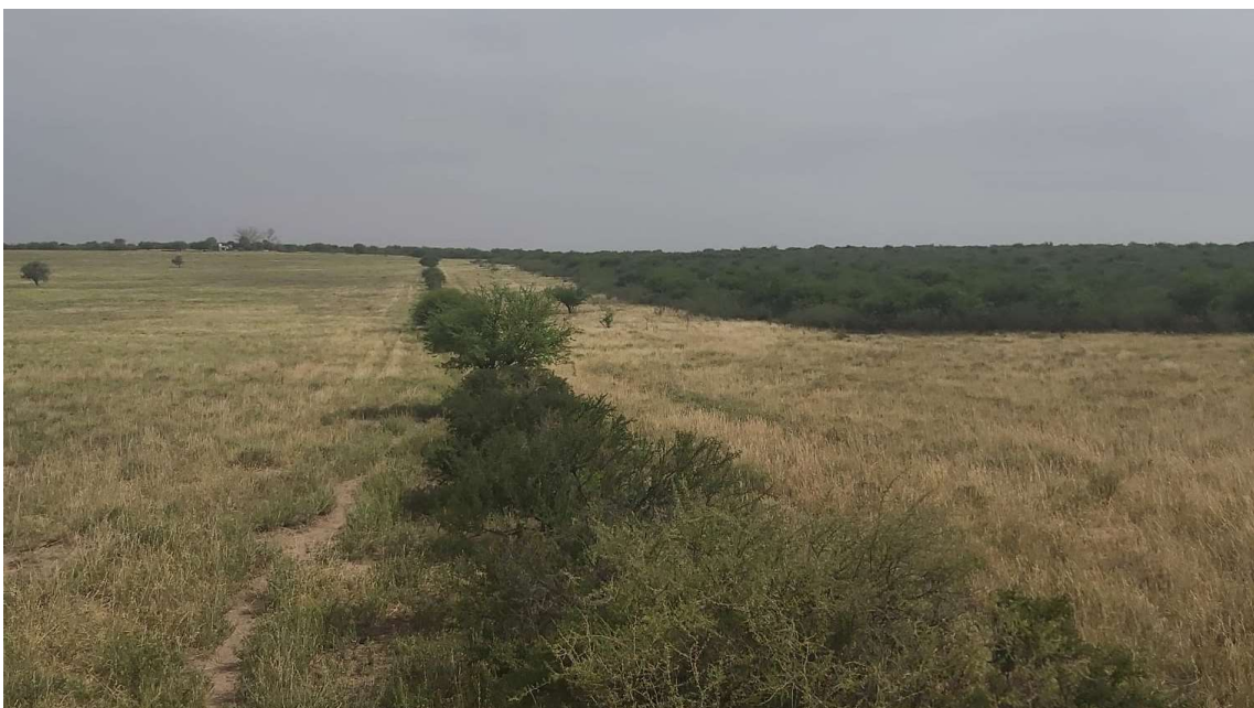
Imagen 5. Alambrado interno que divide el limpio del monte.