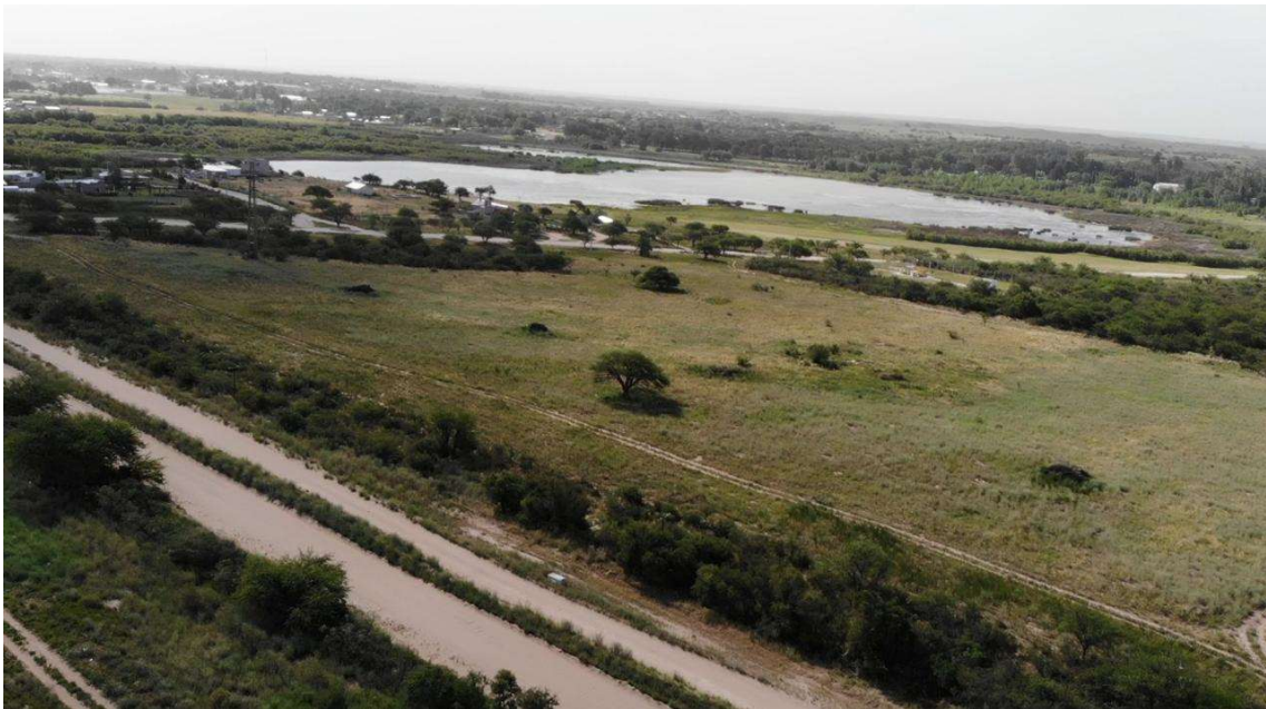
Imagen 2. Cercanía del mirador Quetré Huitrú.