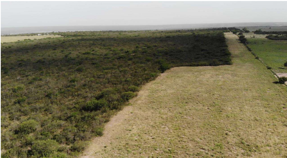
Imagen 4. Imagen aérea del monte con sus picadas en correcto estado de mantenimiento.